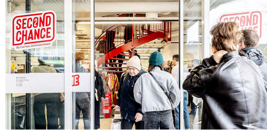
🕒 Der Second Chance hat von Dienstag bis Samstag geöffnet.