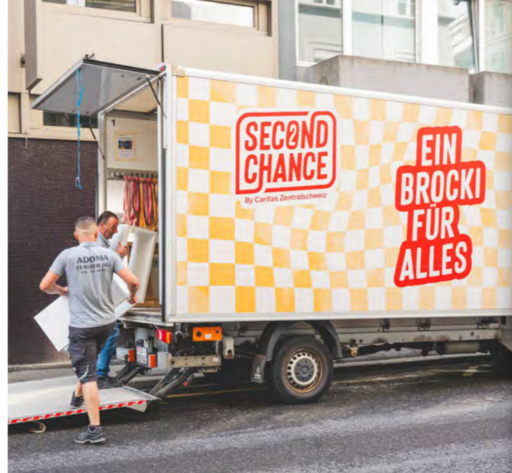
🕒 Gemeinsam mit den Programmteilnehmenden werden Abholungen und Räumungen durchgeführt. Gut erhaltene Ware wird anschließend im Second Chance verkauft.