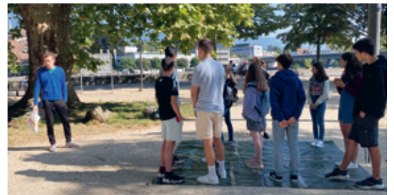
«Vou Ungerschtli!»-Rundgänge für Jugendliche

Nebst der Beratungsarbeit sind auch die Projekt-, Sensibilisierungs- und Vernetzungsarbeit ein wichtiger Bestandteil der KSB. Einmal in der Woche bieten Freiwillige administrative Unterstützung für Ratsuchende an. Sie übersetzen oder schreiben Briefe oder helfen beim Erstellen von Bewerbungsunterlagen und anderen Dokumenten. Die öffentlichen Stadtrundgänge «Vou Ungerschtli!» sowie die Aktion «Eine Million Sterne» sensibilisierten 2021 Jugendliche und die breite Bevölkerung zum Thema Armut im Kanton Solothurn. Mit ihren Angeboten trägt die KSB dazu bei, dass die Kirchen als engagierte und solidarische Institutionen wahrgenommen werden.