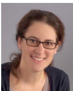
Nathalie Philipp Kommunikation AG/SO

CARITAS Solothurn kommuniziert regelmässig mit verschiedenen Anspruchsgruppen. Hilfesuchende, Freiwillige, Gönner*innen, befreundete Organisationen sowie die breite Öffentlichkeit werden mit diversen Versänden und Kommunikationsmassnahmen analog und digital informiert und angesprochen.