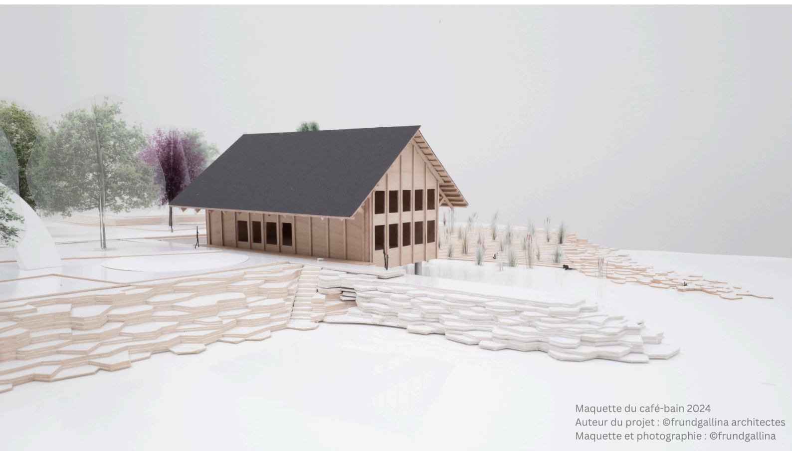
Maquette du café-bain 2024 Auteur du projet : @frundgallina architectes Maquette et photographie : @frundgallina

Le café-bain a été conçu par le bureau d'architecture frundgallina. La construction du bâtiment va démarrer au printemps 2025 et l'ouverture du lieu est prévue au printemps 2026.