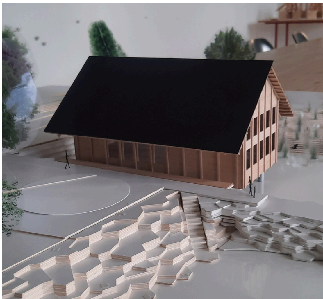
Maquette du café-bain 2024 / Projet frundgallina architectes

Le café-bain a été conçu par le bureau d'architecture frundgallina. La construction du bâtiment va démarrer au printemps 2025 et l'ouverture du lieu est prévue au printemps 2026.