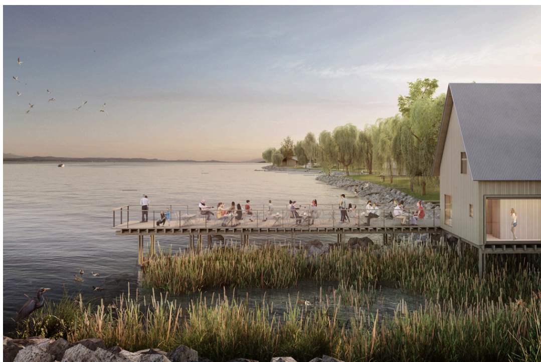
Image de synthèse du café-bain 2019 / Projet frundgallina architectes / Visuel Nightnurs Image

Ce lieu ouvrira ses portes en 2026 et sera doté d'un espace de restauration et de deux saunas chauffés au bois. Il sera construit au bord du lac à Neuchâtel, dans le parc des Jeunes-Rives. Vaste espace vert en plein centre ville, à proximité immédiate de la plage publique, l'emplacement est idyllique.