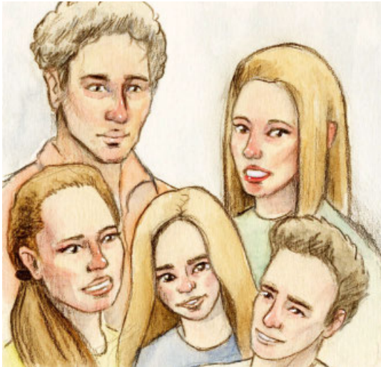
Illustration: Marco Tancredi

Familie Esposito wünscht sich, dass sie so schnell nicht mehr auf Wohnungssuche gehen muss.