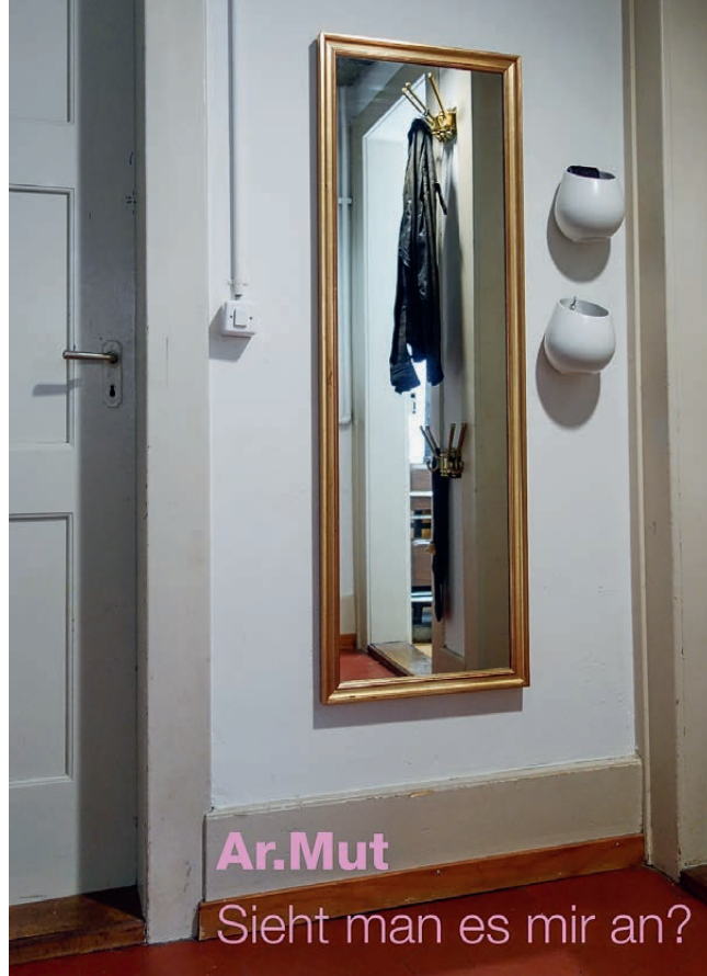
Das Kollektiv impAct will mit «Ar.Mut» Vorurteile abbauen.

Ausserdem ist es uns wichtig, dass sich das Publikum nicht durch Voyeurismus oder Mit-