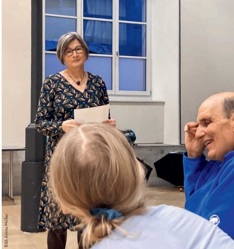
Erste Proben zu den Stadtrundgängen «Päch gha!»